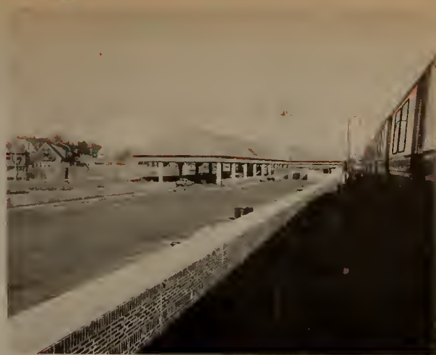
Forest Hills Station, looking north, showing new Washington St. parking lot, bus canopy and proximity of operating Orange Line Rapid Transit

Contrato MBTA 097-306 (DeMatteo Construction Company), contrato de vía de la calle Hall a la calle Walk Hill. La obra está esencialmente terminada. Lo que falta por hacer antes de la inspección final incluye algunas repara-